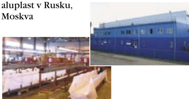
aluplast v Rusku, Moskva