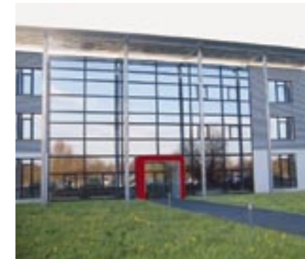
Nová administrativní budova u dálnice A5

vodu v Karlsruhe bude vystavěna nová směšovací věž. Zařízení o ploše 40m x 24m