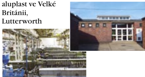
aluplast ve Velké Británii, Lutterworth