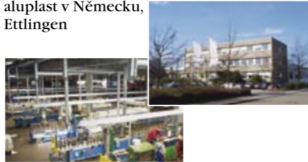
aluplast v Německu, Ettlingen